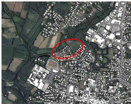
Secteur soumis à l'OAP – Site de Kerojunc

Objectif : Modifier la vocation du secteur Est de l'OAP – Site de Kerojunc en passant d'une vocation équipement d'intérêt général (cimetière) à une vocation habitat. Un projet de cimetière étant déjà en cours sur une partie de l'emplacement réservé n°44 du PLU en vigueur. L'ajustement de l'OAP participe à répondre au renforcement du pôle de centralité du centre-ville à travers le logement.