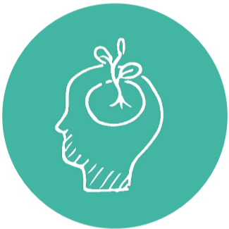
Adaptation au changement climatique