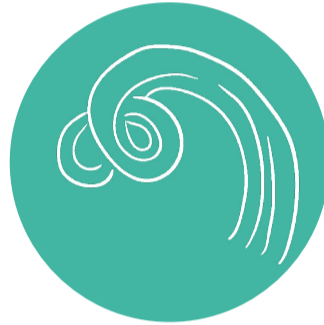
Qualité de l'air